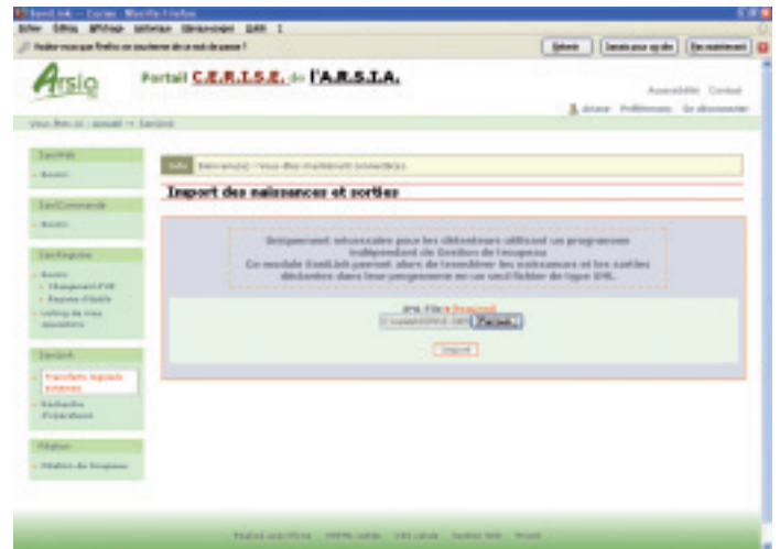
Ecrans de transfert des données d'Ariane vers Cerise